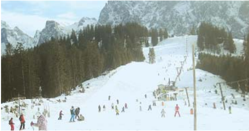
пушки. Катаются по склону

леть которую под силу лишь настоящим профессионалам. Вечерами приятно уставшие на снежном склоне туристы отдыхали в уютных австрийских кафе и ресторанах. Здесь путешественники узнали, что многие местные жители настолько привыкли к родным красотам, что не желают покидать Альпы даже на короткое время. Не хочет отпускать людей горная снежная сказка, зовущая вернуться в Альпы вновь!